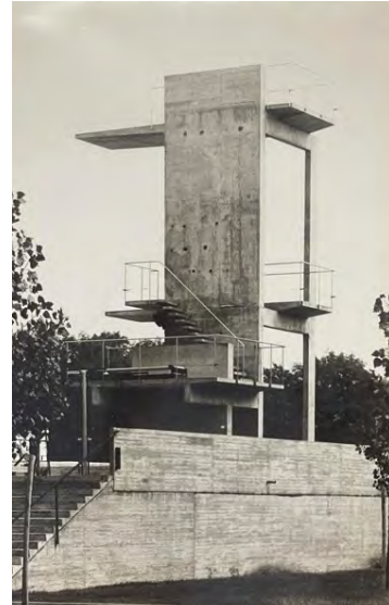
Sprungbecken und Sprungturm 1963