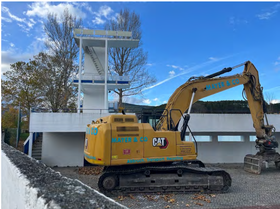
November 2025